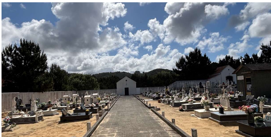
Fig.02. Alçado Poente (interior), 2025