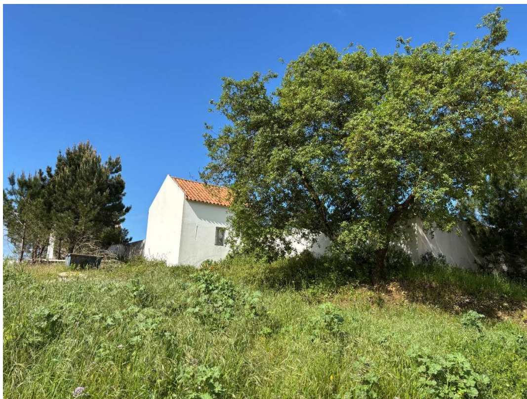
Fig.01. Alçado Nascente, 2025